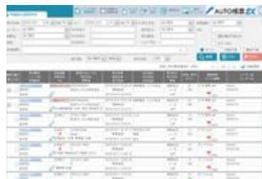
WEB管理画面 イメージ