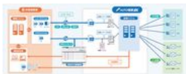
AUTO 帳票EX サービスイメージ図