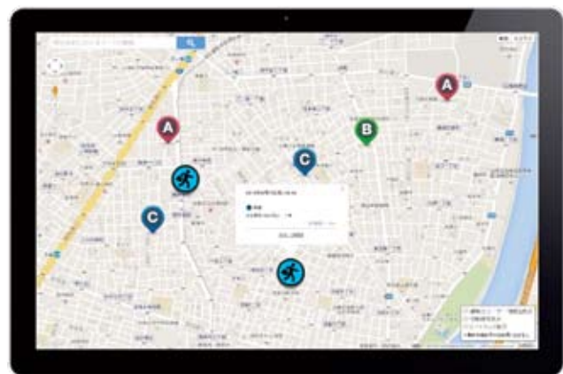
顧客の状況と現場対応の状況を一目で素早く把握